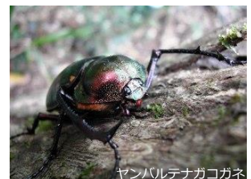
ヤンバルテナゴコガネ