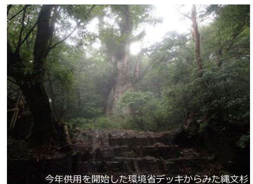
今年供用を開始した環境省デッキからみた縄文杉

前号でお知らせしたとおり、縄文杉の大枝落下の危険回避及び安全確保のため撤去された北デッキに代わり、環境省による新デッキが整備されました。予定通り、3月終わりから供用が開始され、すでに多くの方にご利用いただいています。まだご覧になっていない方、今年は縄文杉発見から50周年でもあるので一度見てみてはいかがでしょうか？